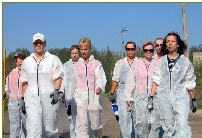
Teeme ära 2008