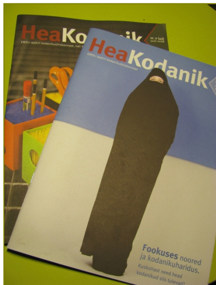
Infolehest ajakirjaks kasvanud Hea Kodanik.