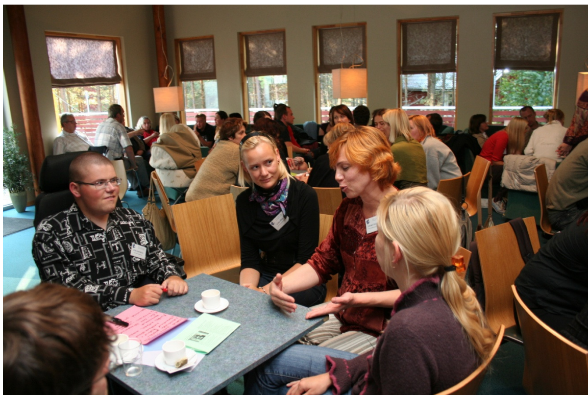
Suvetooli maailmakohvikus vahetasid osalejad mõtteid sellest, milline on hea juht ühendusele.