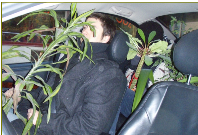
Kolimine uude kontorisse.